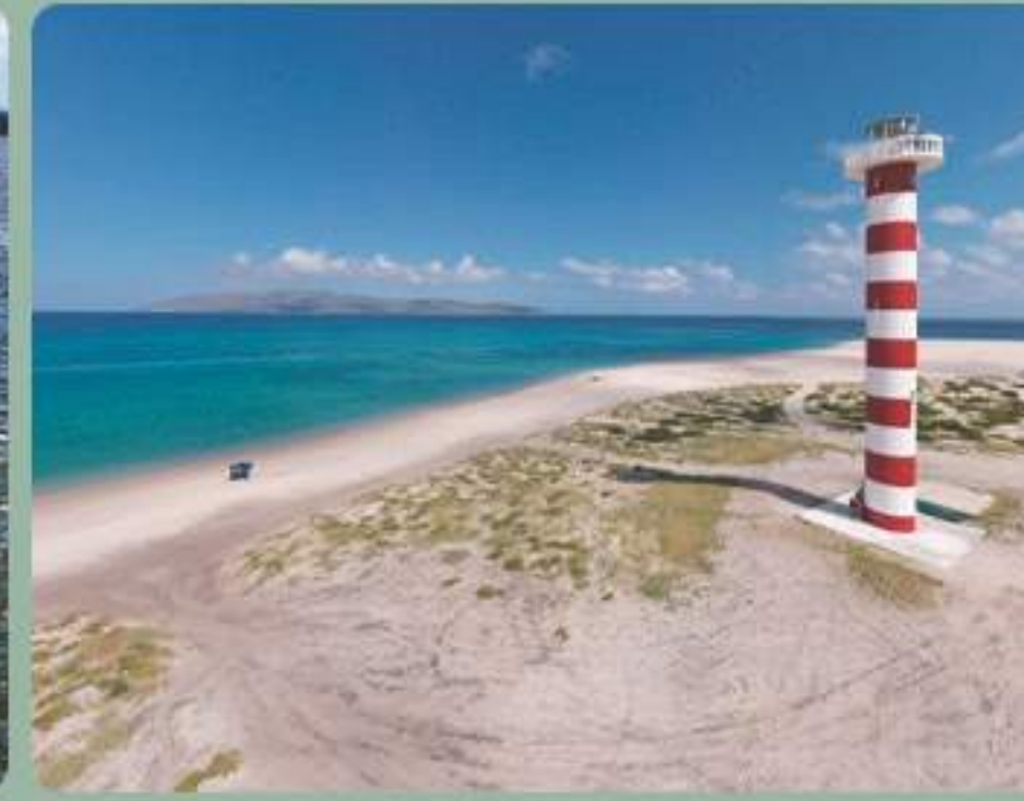
Playa Punta Arena y Santa Clara