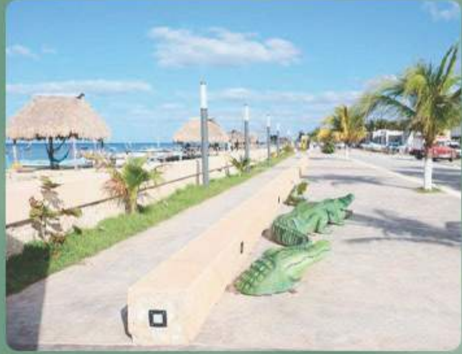
Malecón de Dzilam de Bravo.