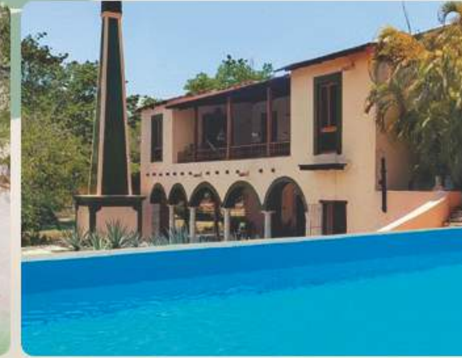
Hacienda Hotel Boutique San Francisco Tzacalha