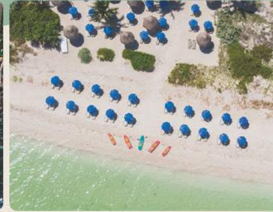
Clubs de Playa