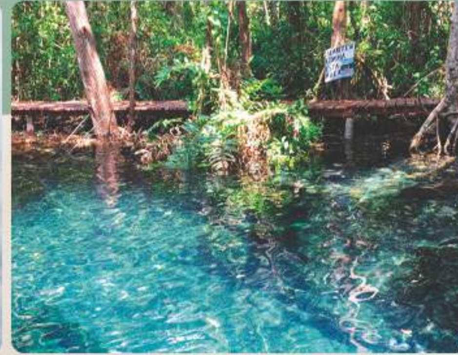
Piedras de ChaKaltún