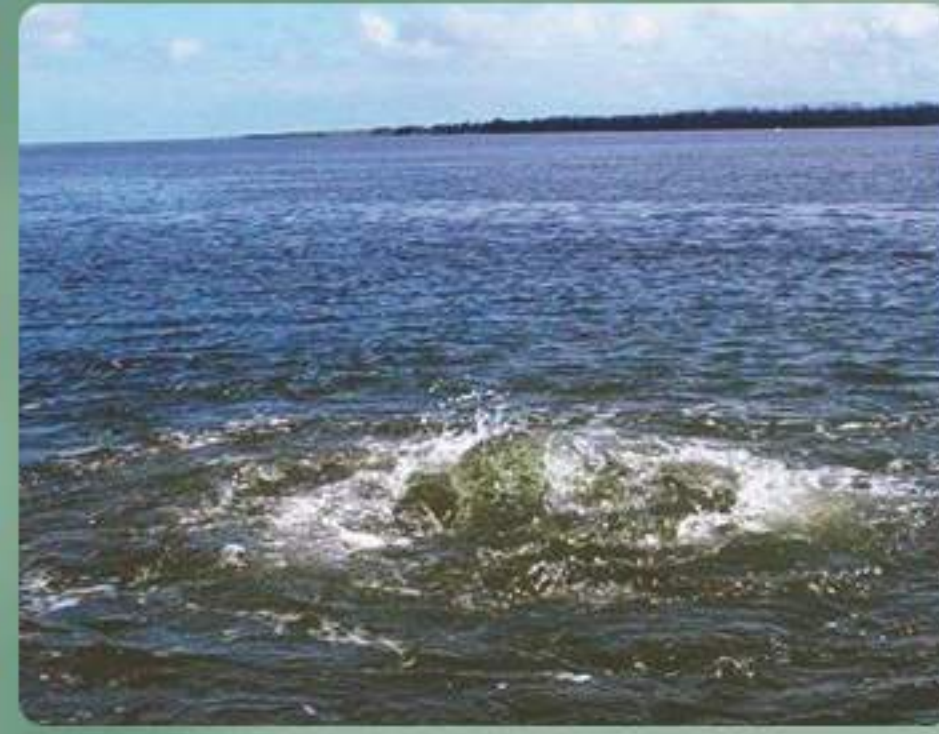
Ojo de Agua Xbuya-há