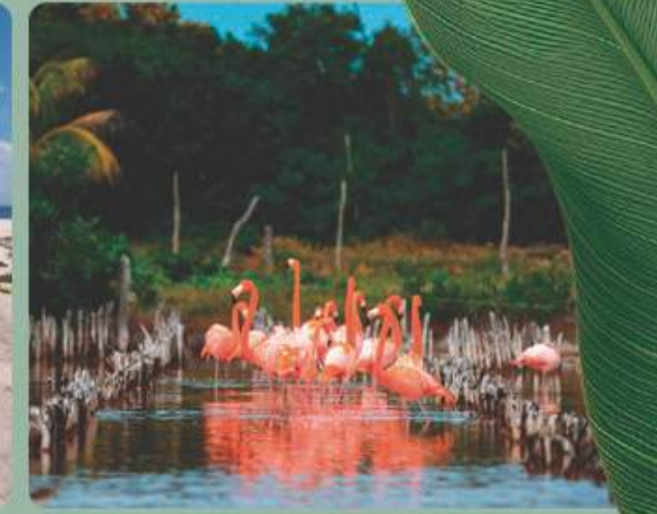
Avistamiento de Flamingos