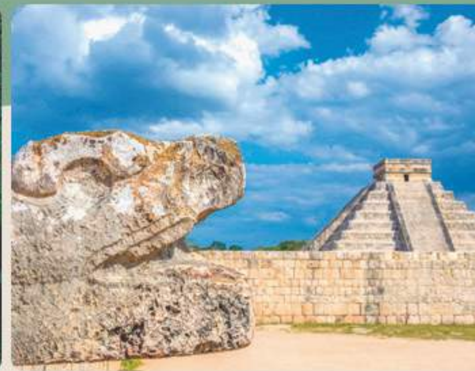
Visita a Ruinas Arqueológicas